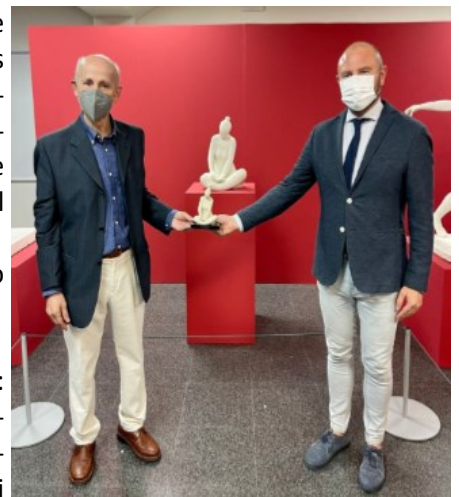
El autor, la obra y el President de la Diputació

Lo demás son excusas impropias de un gobierno que se dice progresista.